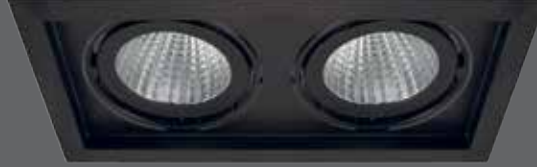
2x20 / 2x30W

Wide power range 15° / 30° / 45° / 60° beam angle Different ral code option