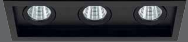
3x8 / 3x10W